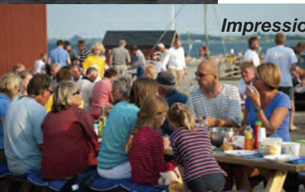
Impressionen von der Seewettfahrt 2010